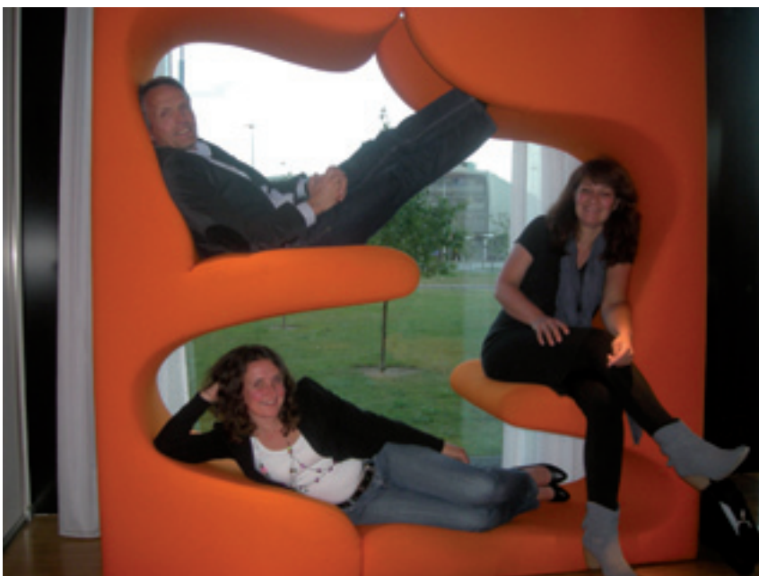
bestuur Microkrediet voor Moeders

De donaties waren het afgelopen jaar aanzienlijk lager dan de voorgaande twee jaren. In 2010 hebben we bijna 48.000 euro aan nieuwe fondsen geworven. In 2008 bedroegen de donaties ruim 82.000 euro en in 2009 meer dan 114.600 euro. Dit verschil met voorgaande jaren is goed te verklaren. In 2008 werden we benaderd door Vrumona om een gezamenlijke actie op te zetten rondom hun merk Crystal Clear. Dit leverde Microkrediet voor Moeders ruim 42.000 euro op. In 2009 kregen we 50.000 euro ‘in de schoot geworpen’ van een stichting die ophield te bestaan. Bovendien is de jaarlijkse donatie van één van onze vaste zakelijk sponsors afgelopen jaar doorgeschoven naar het boekjaar 2011.